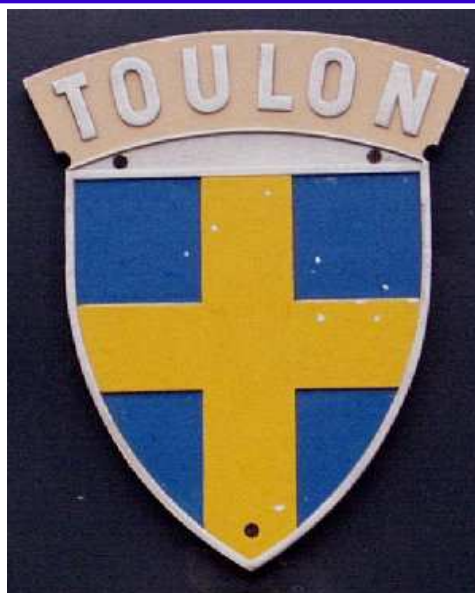
Autre baptême TGV 80 (23 mai 1984). Blason toujours en place.