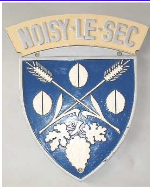
Blason en place sur la CC 72177.