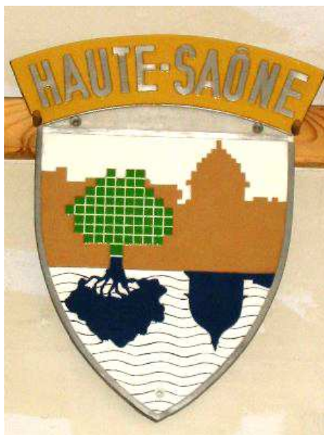
Blason en place sur la CC 72148.