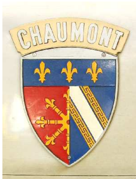
Blason en place sur la CC 72141.