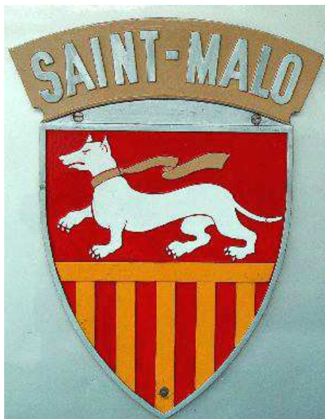
Blason en place sur la CC 72172.