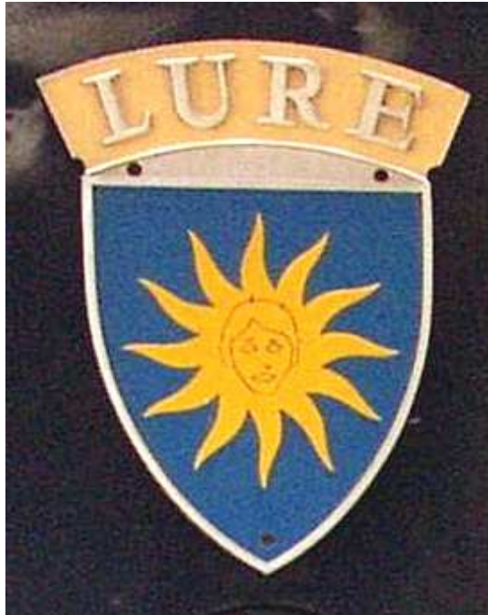
Ce blason Lure a été transféré sur la CC 72025 lors de la RL le 5 juillet 1993. Disparu lors de la radiation le 22 décembre 2005

Dans la « Bible » quelques inexactitudes concernent les blasons :