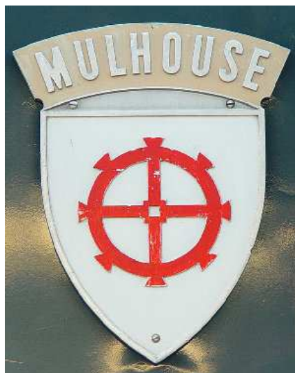
Autre baptême TGV 91 (27 septembre 1986). Blason en place sur la CC 72180.