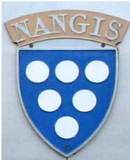
Blason en place sur la CC 72138.